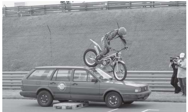
Bei der Motorrad-Stunt-Show Freestyle Motocross waren die Zuschauer aus dem Häuschen.