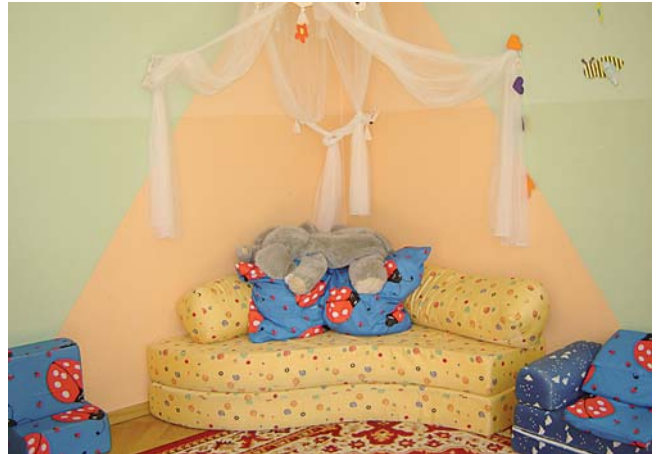
Die Kuschecke lädt ein zum Träumen und Verweilen.

Insgesamt wurden knapp 400.000 Euro bereit gestellt, um den Kindergarten zu modernisieren. Das Haus und seine Räume haben sich in wahre Schmückstücke verwandelt.