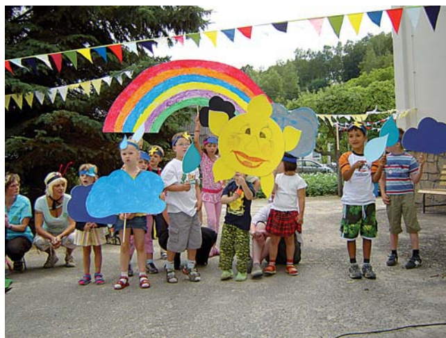
Foto: Die Kindergartengruppen "Wilde Hummeln" und "Schlaufüchse".