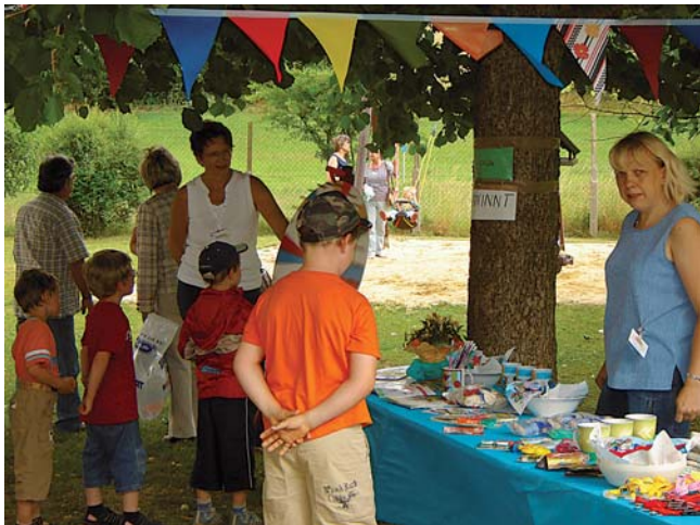
Am Glücksrad versuchte so mancher sein Glück.