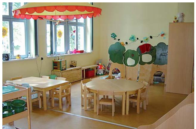
Zum Spielen und Lernen gibt es für 50 kleine Helden genug Platz.

Auch die Sanitäranlagen wurden auf den neuesten Stand gebracht. Hier wird jetzt die Körperpflege zum täglichen Abenteuer.