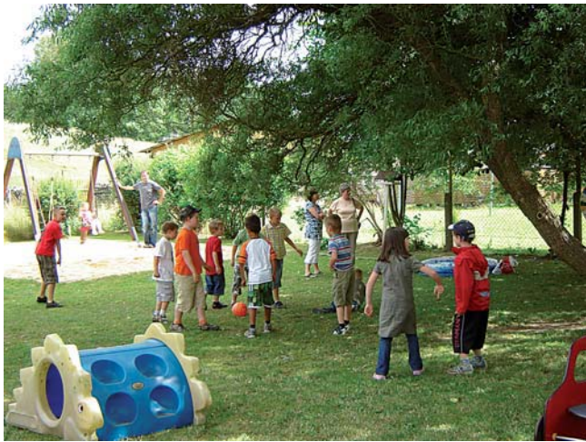
Auf dem eigenen Spielplatz, der von viel Grün und dem nahe gelegenen Wald umgeben ist, lässt es sich für die Kleinen am besten toben. Bewegung, Spiel und Sport gehören neben Musikschule und anderen tollen Angeboten zum Kindergartenalltag.