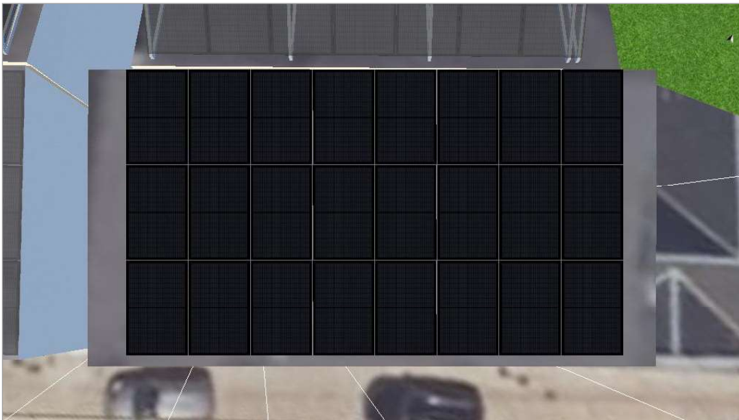
Abbildung: 2. Modulfläche - Gebäude 01-Dachfläche Südost